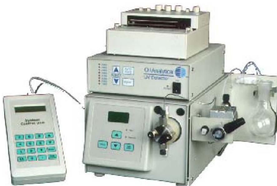
图 1 SP 2000 型 GPC 净化系统配置 OI 分析仪器公司的 UV 检测器/表格记录仪